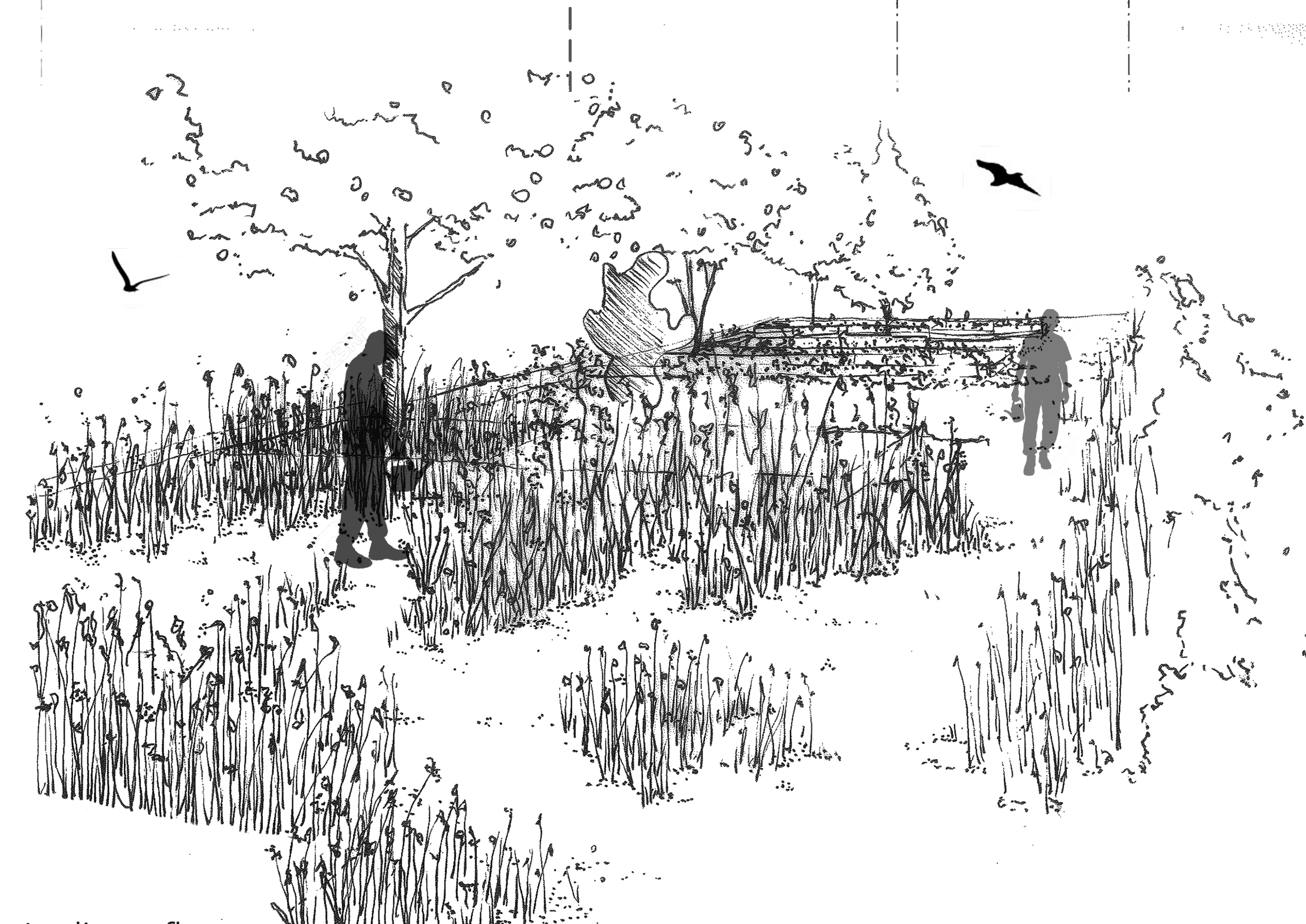
Jardin en fleurs

Le premier espace accessible est dédié aux fleurs, les espèces privilégiées sont pérennes et sont adaptées pour la confection de bouquets. Les visiteurs pourront y cueillir (non exhaustif) des roses, cosmos, pavots, lavatères, coquelicot, oeillets, hortensias, bourrache, asters ou nigelles, ainsi que des feuilles de fougères.