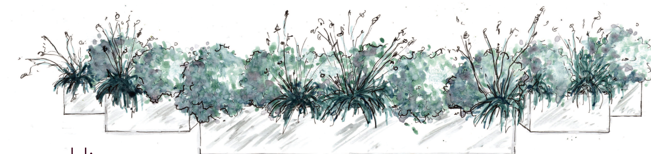
Hiver Ligne noire